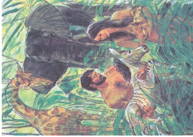
Святая Библия. Книга Бытия. Глава 1. Стих 26-27.

Po stvorení bol na človeka nádherný pohľad, ako na obraz Boží, tvory ho videli a bali sa ho, lebo si mysleli, že je ich tvorcom. Ale v skutočnosti človek nie je totožný s Bohom, avšak Boha neprehliadnuteľne pripomína. Oba